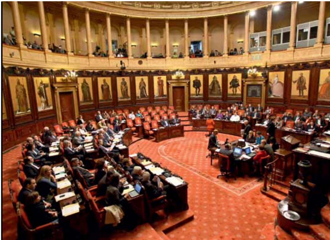
De verkozen Senaat wordt afgeschaft na 2014.