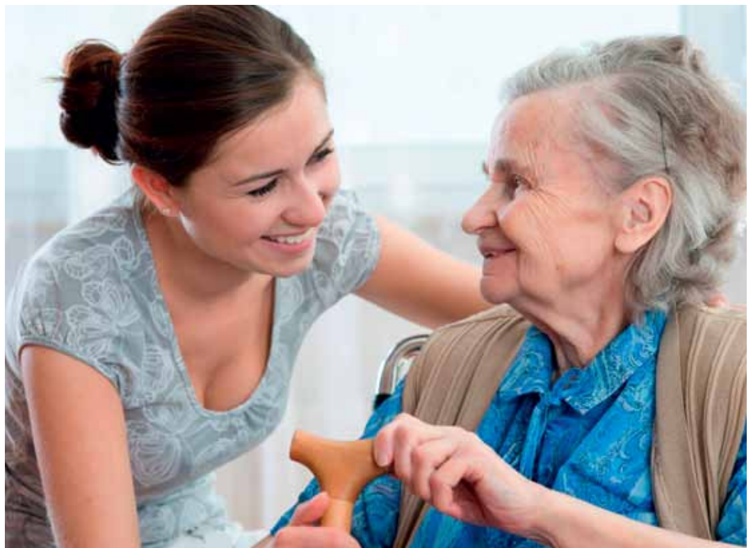
De wachtlijsten in welzijn blijven aanhouden.

welzijn. “Het zal niet volstaan om te durven groeien”, zei Van Rouveroij. “Om te kunnen groeien zal Vlaanderen keuzes moeten maken. Zoals een drijvelaar alleen maar vruchten draagt als hij goed wordt gesnoeid.”