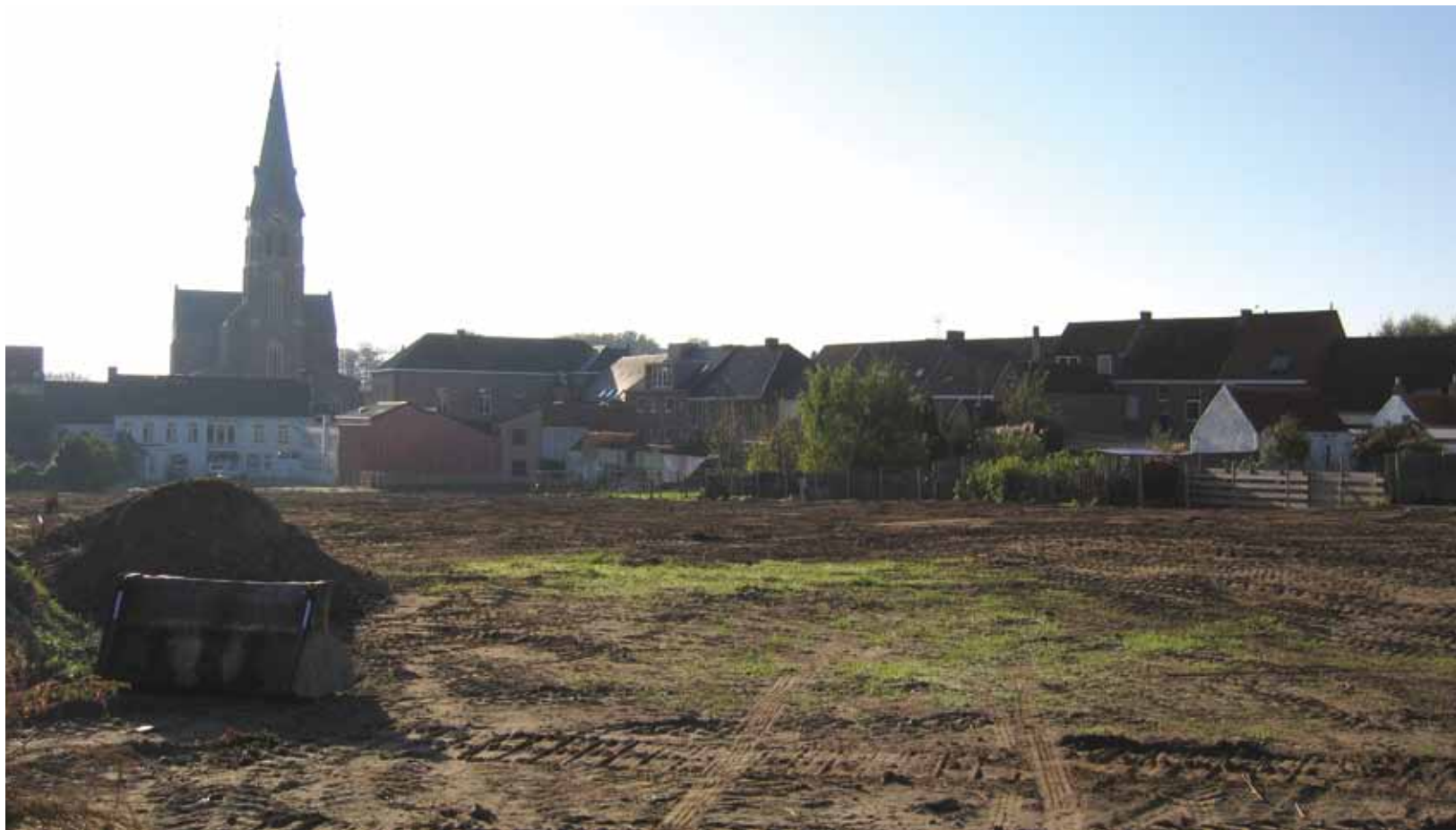
Deel van het terrein voor het inbreidingsproject.