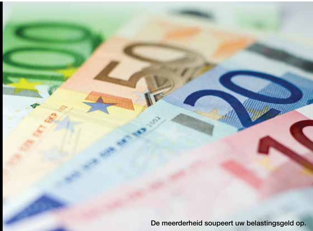
De meerderheid soupeert uw belastinggeld op.

5. De huidige investeringshonger op de rug van de Kruishoutemse belastingbetaler moet stoppen: de tering moet naar de nering gezet