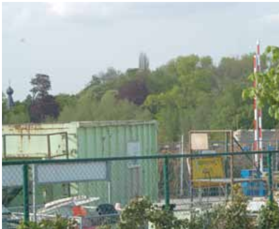
Het containerpark zorgt op de huidige locatie voor een pak verkeersoverlast in het centrum.

Open Vld kaart deze problematiek sinds jaren aan bij