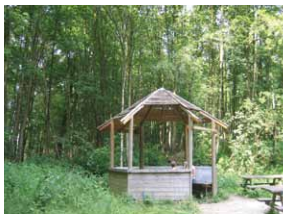
Het prieeltje bevindt zich in een erbarmelijke staat.

Lozer bos wordt door de Vlaamse landmaatschappij en de gemeente sterk gepromoot als recreatief gebied en dat is zeker niet onterecht. Wandelaars, fietsers, ruiters en mountainbikers vinden er hun gading en binnen het bos werd ook de open speelzone heringericht met natuurlijke materialen. Het valt echter te betreuren dat het schuilhuisje - of prieeltje zoals men het wel eens noemt - zich in een erbarmelijke staat bevindt. De dakbedekking is nagenoeg totaal verdwenen en in slechte staat. Bovendien is deze toestand een reëel gevaar voor onze kinderen. Aan de bevoegde schepen: DOE DAAR IETS AAN AUB!!!