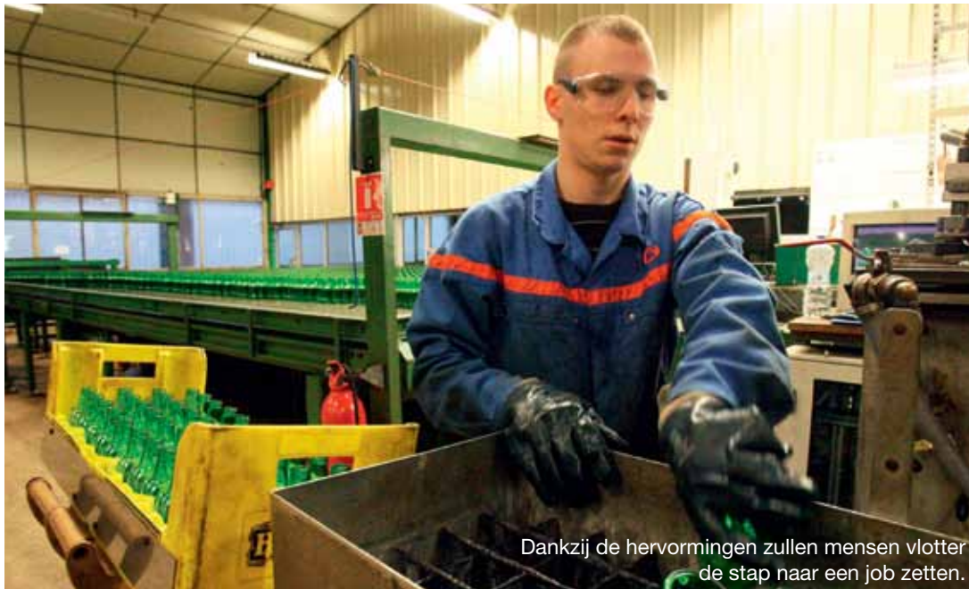
Dankzij de hervormingen zullen mensen vlotter de stap naar een job zetten.

Open Vld is tevreden dat de federale regering volop werk maakt van de hervorming van de werkloosheidsuitkeringen. Die zullen voortaan sterker dalen in de tijd, om na maximaal vier jaar te eindigen op een forfaitaire uitkering, in de buurt van het leefloon. Alexander De Croo: "Deze hervorming is het sluitstuk van een activerend werkloosheidsbeleid. Door de stapsgewijze daling van de werkloosheidsuitkeringen wordt de kloof met werken groter en zetten mensen vlotter de stap naar een job."