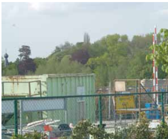
Het containerpark zorgt op de huidige locatie voor een pak verkeersoverlast in het centrum.

Open Vld kaart deze problematiek sinds jaren aan bij