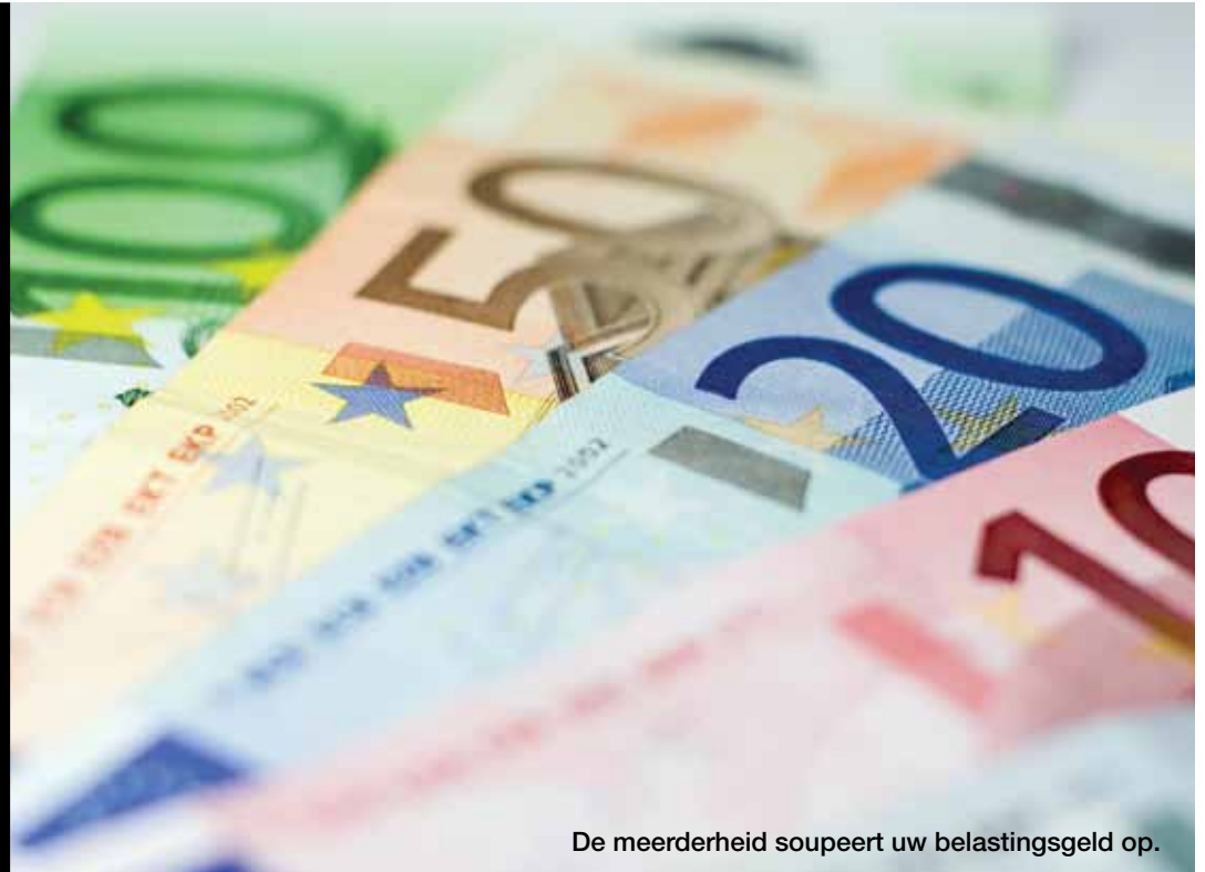
De meerderheid soupeert uw belastinggeld op.

5. De huidige investeringshonger op de rug van de Kruishoutemse belastingbetaler moet stoppen: de tering moet naar de nering gezet