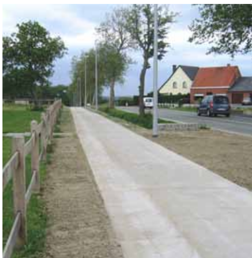
Nieuw fietspad Olsensesteenweg.

toespraak van het kabinet Crevits, maar dat hij niet wist waar dit verschil vandaan kwam. Nu moet ik zeggen dat als er bij mij een verschil van 130.000 EUR zou zitten, ik toch binnen het uur zou willen weten vanwaar dit verschil komt. 14 dagen later had de schepen daar nog niet aan gedacht. Ik heb hem dan ook gevraagd om mij tegen de volgende gemeenteraad uitdrukkelijk mee te delen wie de juiste cijfers naar voor heeft gebracht, zodat wij weten wie de bevolking juist heeft ingelicht en wie niet. Wij houden u op de hoogte... en geniet ondertussen van het mooie fietspad!