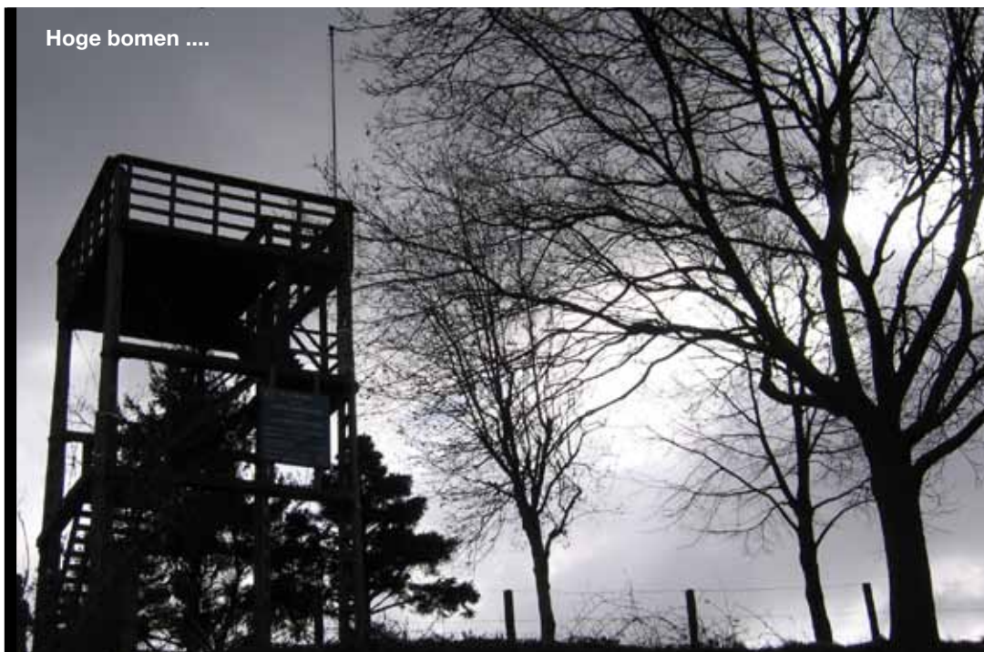
Hoge bomen ....