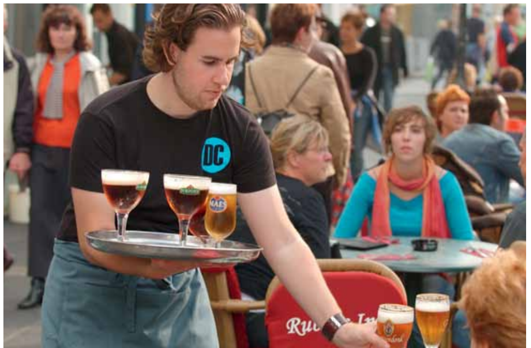
Wat voor studenten kan, moet ook voor anderen kunnen.

Vaak hoor je zeggen dat de mini-jobs tot ‘sociale afbraak’ zouden leiden, met een verwijzing naar Duitsland als het slechte voorbeeld van zo’n systeem. Ten onrechte, want België is Duitsland niet: onze arbeidsmarkt en ons systeem van sociale bescherming zijn totaal verschillend. We moeten de mensen dan ook geen angst aanjagen. Het is niet de bedoeling om reguliere arbeid en een volwaardige sociale bescherming op de helling te zetten. Daarvoor is ons systeem van sociale zekerheid ons te dierbaar.