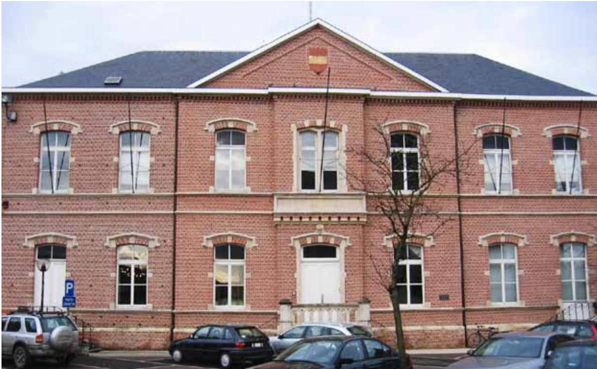
Normvervaging bij het college van burgemeester en schepenen in Kruishoutem.