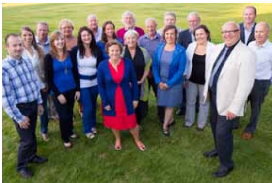
Het team van Open Vld Kruishoutem verwelkomt u met open armen.