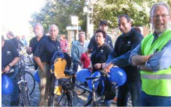
Het inrijden van het fietspad in Lozer (2006) en de Olsensesteenweg (2013) was ook voor Open Vld een feestelijk moment.

Wij wensen alles in het werk te stellen voor de versnelde aanleg van fietspaden: het is immers van het grootste belang dat onze kinderen veilig naar het centrum van Kruishoutem kunnen fietsen langs deze invalswegen. Om de veiligheid te garanderen voor zowel onze schoolgaande jeugd als de recreatieve fietsers, zijn bovendien extra maatregelen nodig, zoals het aanbrengen van rode fietsstroken op de gemeentewegen in de