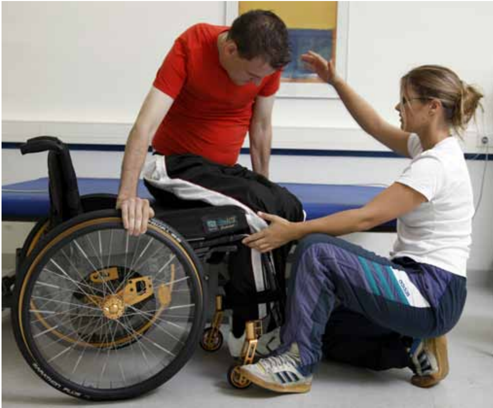
De wachtlijsten in de gehandicaptenzorg blijven lang.

De wachtlijsten in de gehandicaptenzorg blijven lang. Open Vld vreest dat de nieuwe plannen van minister Vandeurzen geen antwoord zullen bieden op de vele noden.