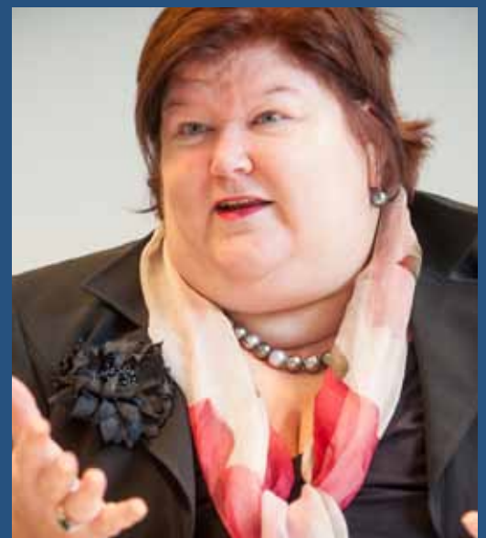
Staatssecretaris Maggie De Block

Het doel van de lijst met veilige landen was en is oneigenlijk gebruik van asielprocedures, bv. door economische vluchtelingen, tegen te gaan. Maggie De Block wil er ook voor zorgen dat de asieldiensten de dossiers van mensen uit de veilige herkomstlanden sneller kunnen afhandelen en dat daardoor sneller plaatsen in het opvangnetwerk vrijkomen. Asielaanvragen uit deze veilige landen worden in eerste aanleg door het CGVS binnen 15 werkdagen behandeld. Het principe van een veilig land van herkomst werd begin 2012 in de Belgische Vreemdelingenwet ingevoerd. De lijst wordt minstens eenmaal per jaar geëvalueerd en aangepast. Het is dus perfect mogelijk dat in de toekomst landen van de lijst worden gehaald of andere worden toegevoegd.